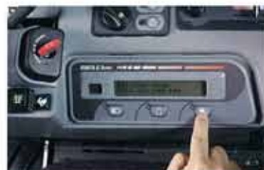
1 Introducir la llave roja de registro y pulsar el botón del panel digital.