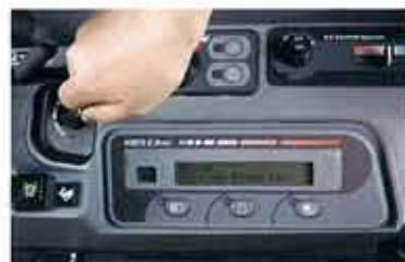
2 Introducir la nueva llave negra operativa.